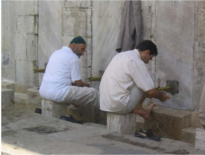
Megtisztulás az ima előtt

Ez a hadisz az alapja, hogy az iszlám szerint harám a paróka, és harám a készítése meg a feltevése is. Az átok a fodrászt is sújtja.