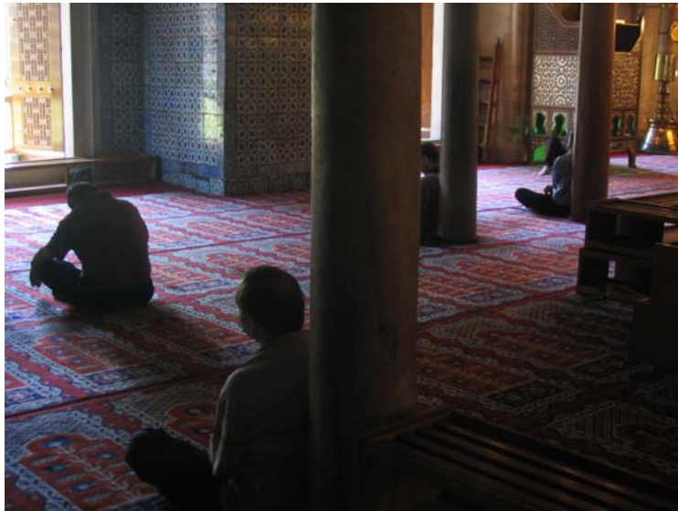
Imádkozás a Mecsetben

Az elektronikus könyvtár teljes szövegű dokumentumokat tartalmaz biztosítva a szabad Információ-hozzáférést. A szerzői és egyéb jogok a dokumentum szerzőjét/tulajdonosát illeti. Az elektronikus könyvtár dokumentumai szabadon felhasználhatók változtatások nélkül a forrásra való megfelelő hivatkozással, de csak saját célra nem kereskedelmi jellegű alkalmazásokhoz