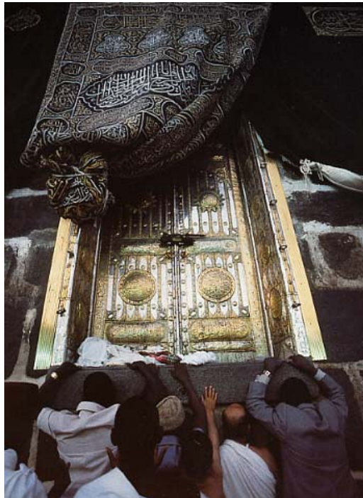
A Mekkai Nagy Mecset Don Belt, National Geographic

Tehát amikor megcsókolják, vagy megsimogatják a fekete követ, ezt csak a Prófétára való emlékezésért, az iránta való tisztelet kinyilvánításaként teszik.