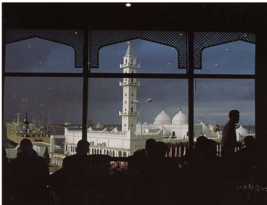
Don Belt, National Geographic

napjainkban az érdeklődés középpontjába került, félreérthetősége és a radikális iszlámban betöltött szerepe miatt. Szeretnék az iszlám világnak és vallásnak minden oldaláról hiteles képet nyújtani az ott élő emberek szokásainak, hagyományainak és protokolljának segítségével.